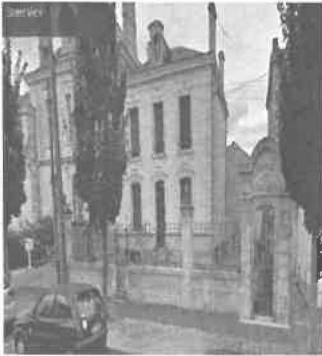
Petit passage avant la poste et une autre maison privée.