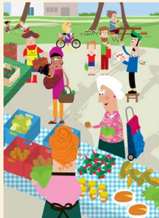
Illustration : Stéphanie Bioret

Aux six producteurs habituels de l'Amap, qui ont proposé fruits et légumes, pain, viande, fromages, se sont ajoutés dix étals gourmands ou plaisants : miel, confitures, vins, savons bios.