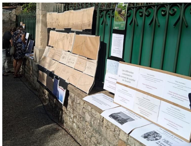
L'exposition du Lambon Opal&sens par Chantal GADREAU